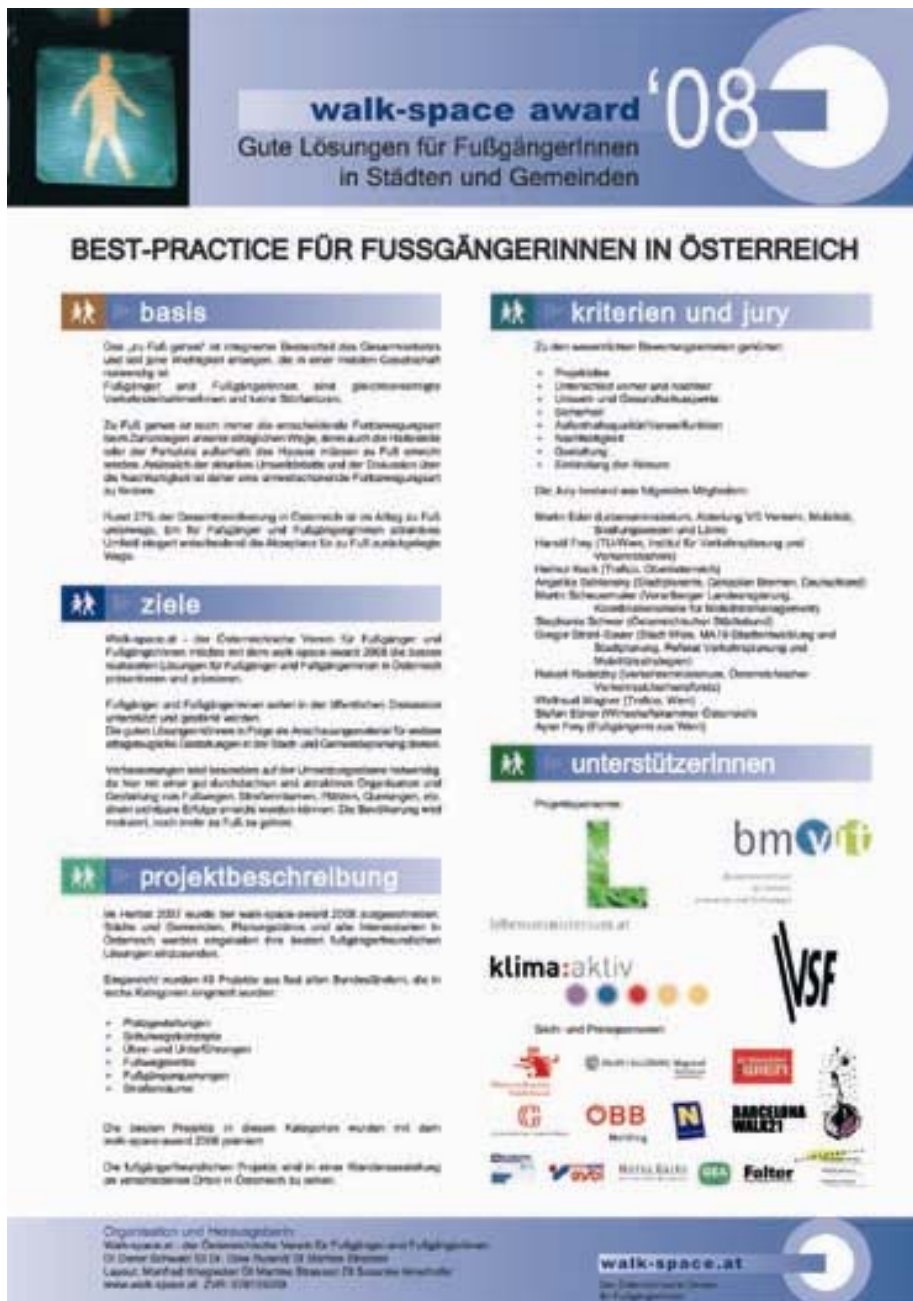
Figure 4: Poster- description of the walk-space-award 2008

The best projects in the different categories were awarded with the walk-space-award 2008. All submitted projects were displayed in an exhibition in the frame of the awarding ceremony.