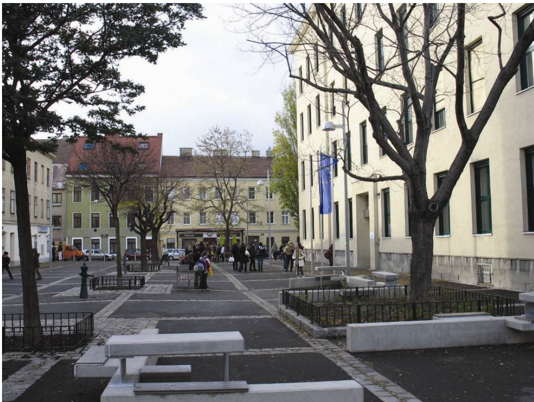
Figure 6: Area in front of the school at Pahamer Platz, Gebietsbetreuung Wien Hernals