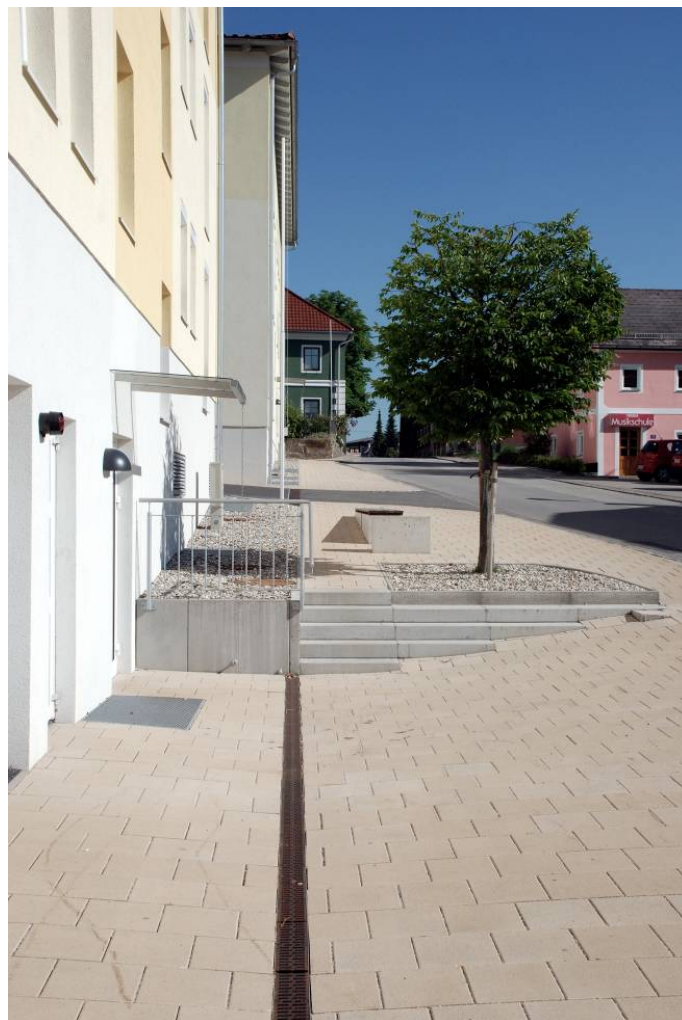
Figure 10: Redesign of the whole city limit, Reichnau im Mühlkreis, Architekt Henter, Oberösterreich