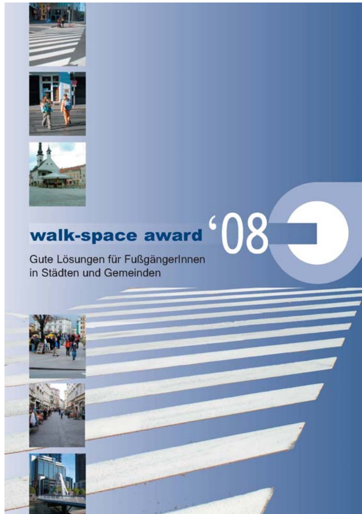
Figure 12: walk-space brochure „collection of good results“

Apart from the awarding ceremony and the “road-show” (travelling exhibition) a brochure containing the collection of good results was printed and distributed.