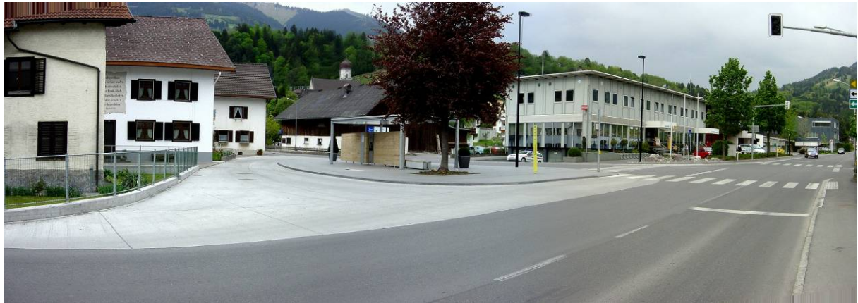
Figure 9: Pedestrian crossings, Gemeinde Thüringen, Besch und Partner, Vorarlberg