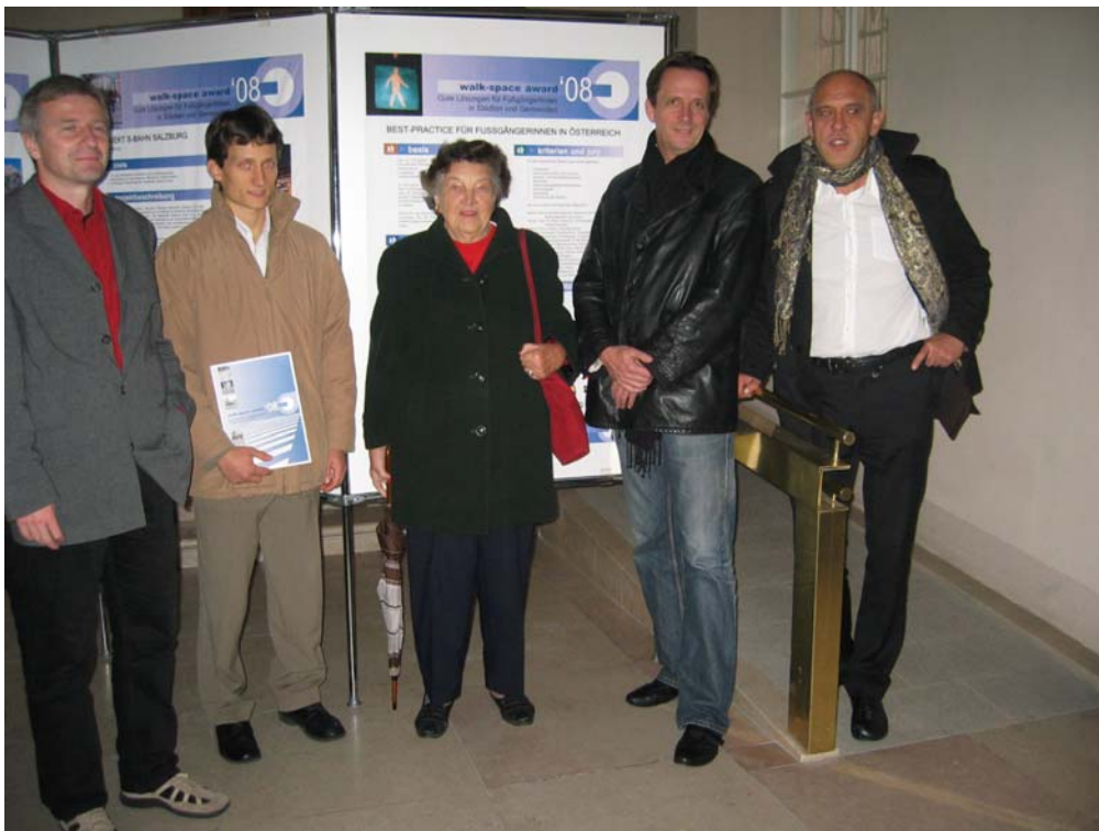
“Road-Show” Salzburg.