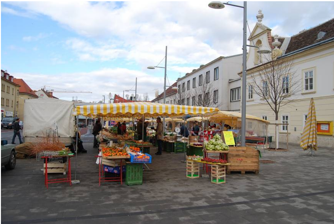
Figure 5: Redesign of the main square. Stadtgemeinde Schwechat, Niederösterreich, Architekt Kuzmich