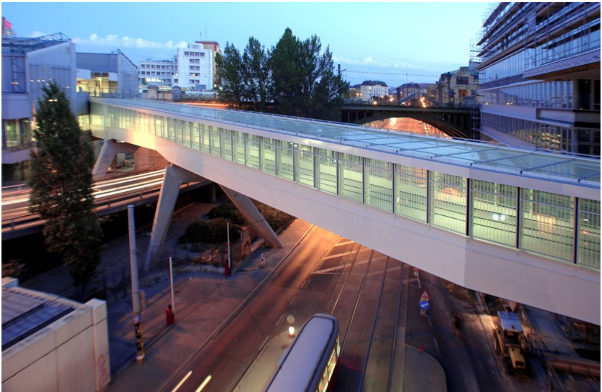
Figure 7: Vienna, MA 29, Skywalk